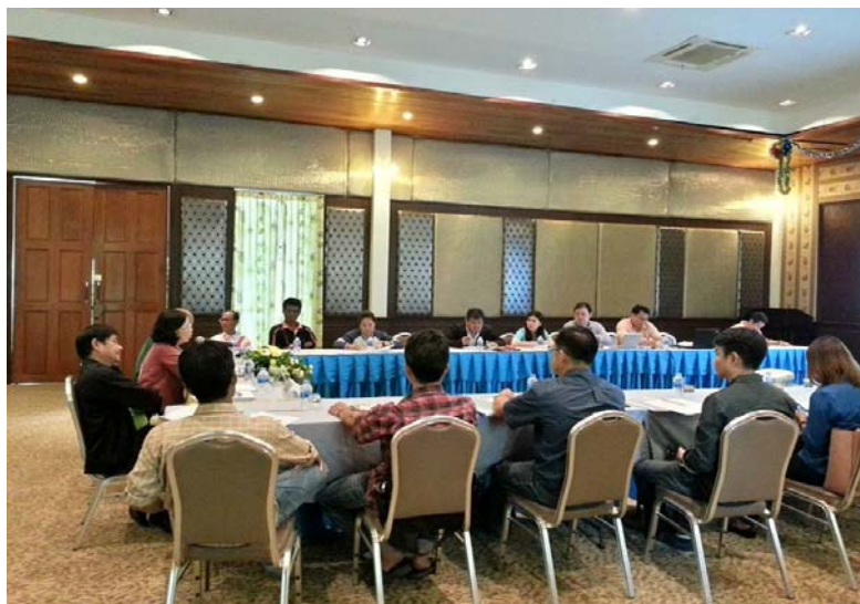
รูปที่ 1 การประชุมคณะกรรมการไตรภาคีฯ

การประชุมครั้งนี้ กรมควบคุมมลพิษได้นำเสนอรายละเอียดการดำเนินการและกิจกรรมที่เกี่ยวข้องกับโครงการฟื้นฟูลำห้วยคลิตี้จากการปนเปื้อนสารตะกั่ว จังหวัดกาญจนบุรี ซึ่งอยู่ในกระบวนการจัดจ้าง โดยมีวัตถุประสงค์เพื่อให้คณะกรรมการทุกท่านได้เข้าใจขั้นตอนการดำเนินการของโครงการและติดตามการดำเนินงานของโครงการ