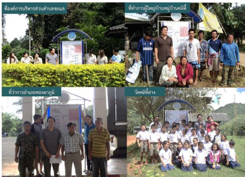
รูปที่ 1 การติดป้ายประชาสัมพันธ์ข้อมูลคุณภาพสิ่งแวดล้อมบริเวณห้วยคลิตี้ ครั้งที่ 4/2557